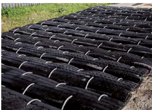
Maße: 3,00 m x 6,00 m, Gewicht: 1.300 kg

Automatisierte Produktionsprozesse ermöglichen es, Sprengschutzmatten gemäß den Erwartungen des Kunden herzustellen.